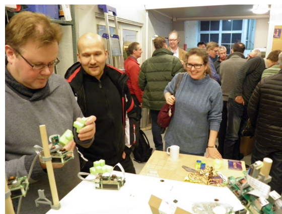
Vaasa Hacklab 1/2016

TEKNILLISTÄ SEURATOIMINTAA VAASASSA VUODESTA 1919