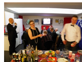
1920-luvun teemapikkujoulut Ateljeessa 11/2015

kasti osoitteesta https://www.facebook.com/groups/52263434318/ ).