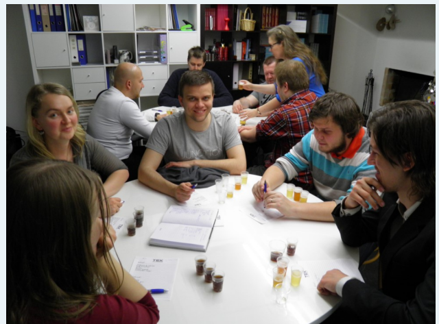
Ystävänpäiväkisa 2016: VTS 2,50 - Tutti 1,25

raimo.sillanpaa@anvianet.fi, puh. 050 334 1191.