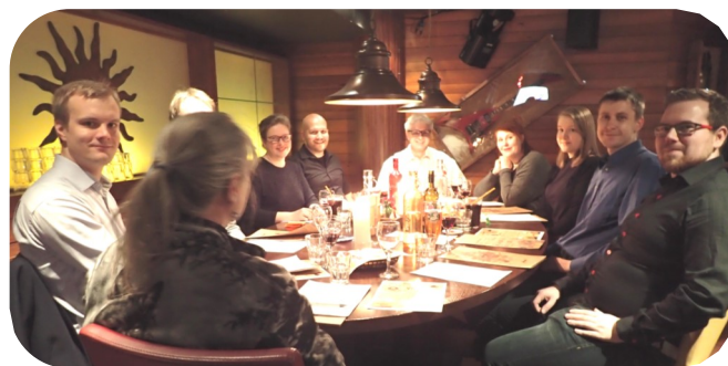
Vaihtokokous Amarillossa 9.1.2017